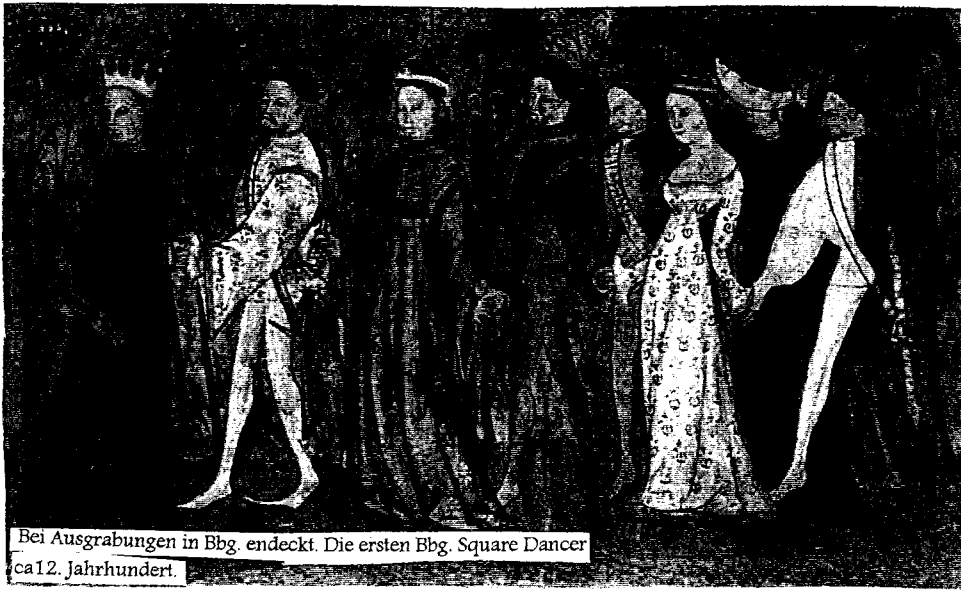
Bei Ausgrabungen in Bbg. entdeckt. Die ersten Bbg. Square Dancer ca. 12. Jahrhundert.